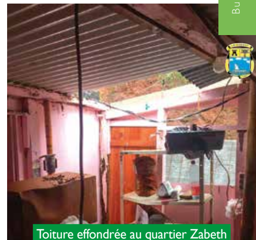
Toiture effondrée au quartier Zabeth