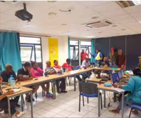
Le Maire, les élus et les agents au PC de crise