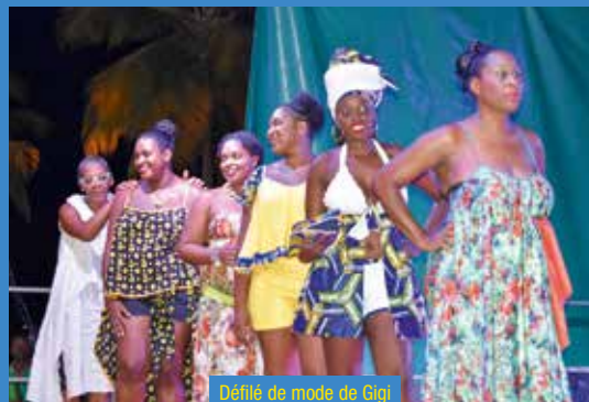
Défilé de mode de Gigi