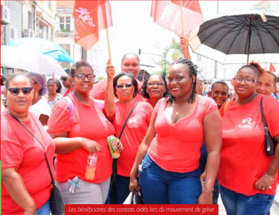
Les bénéficiaires des contrats aidés lors du mouvement de grève