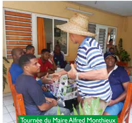
Tournée du Maire Alfred Monthieux dans les quartiers