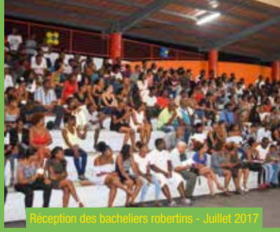
Réception des bacheliers robertins - Juillet 2017