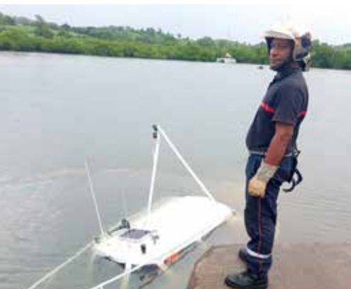
Naufrage du bateau pilote de la capitainerie « Le STERNE » au port de Reynoird qui a causé un début de pollution marine (hydrocarbure)