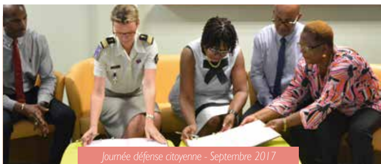
Journée défense citoyenne - Septembre 2017

Plus de 250 jeunes ont participé à ce village qui est reconduit chaque année.