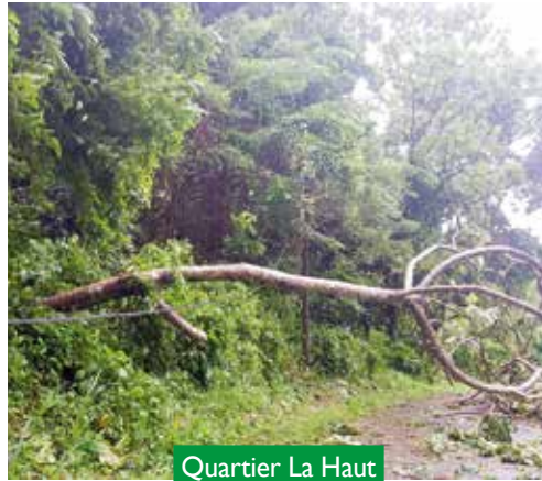
Quartier La Haut