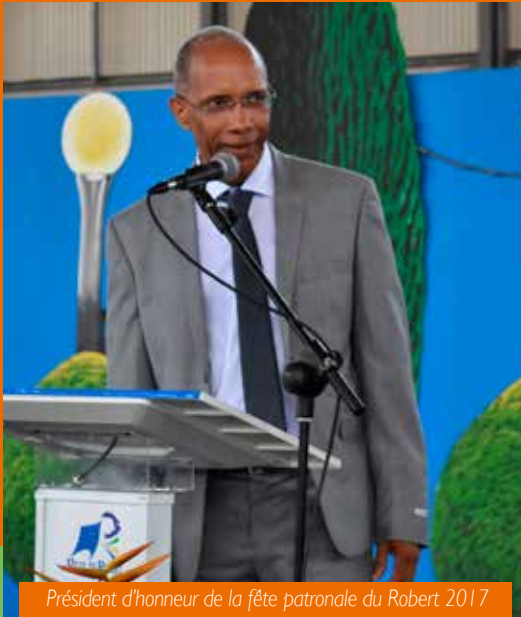
Président d'honneur de la fête patronale du Robert 2017