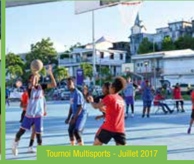
Tournoi Multisports - Juillet 2017