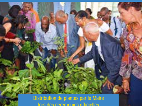
Distribution de plantes par le Maire lors des cérémonies officielles