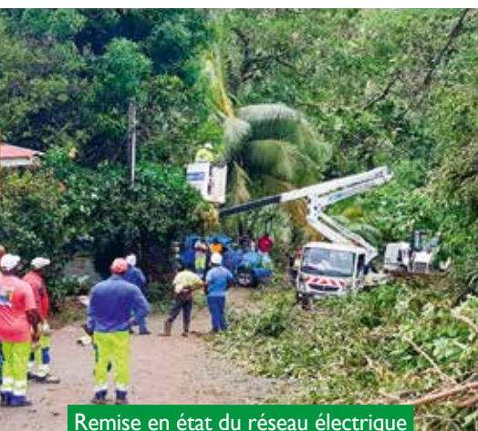
Remise en état du réseau électrique à Duchesne