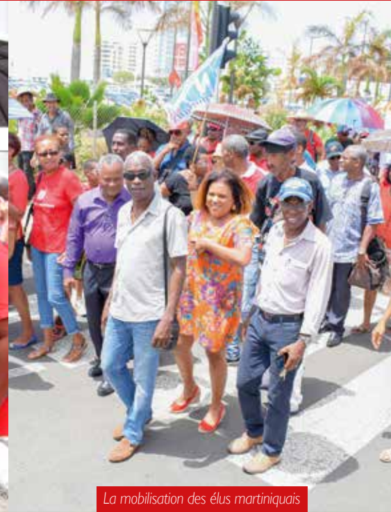
La mobilisation des élus martiniquais