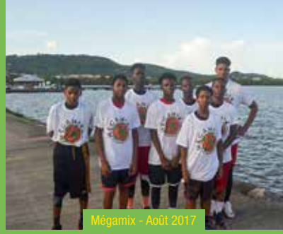
Mégamix - Août 2017