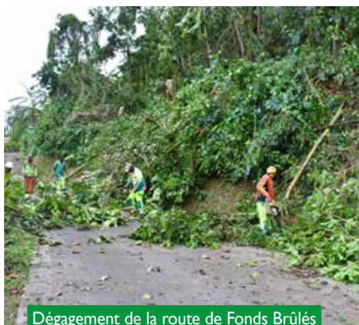
Dégagement de la route de Fonds Brûlés