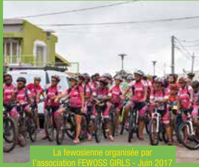
La fewosienne organisée par l'association FEWOSS GIRLS - Juin 2017