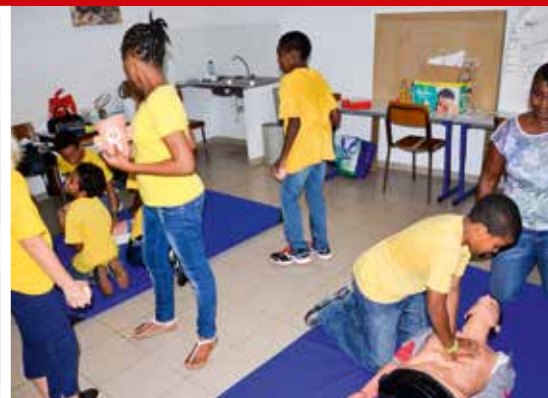
Caisse des écoles : les actions politiques de la Ville