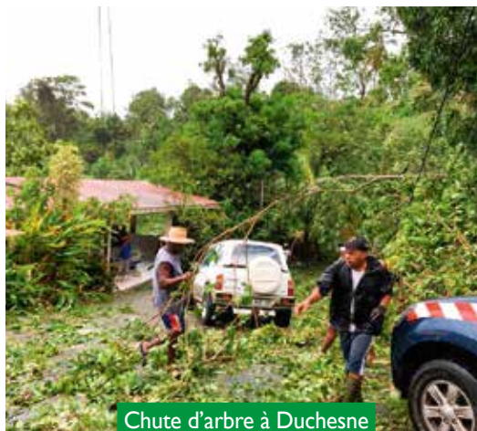
Chute d'arbre à Duchesne