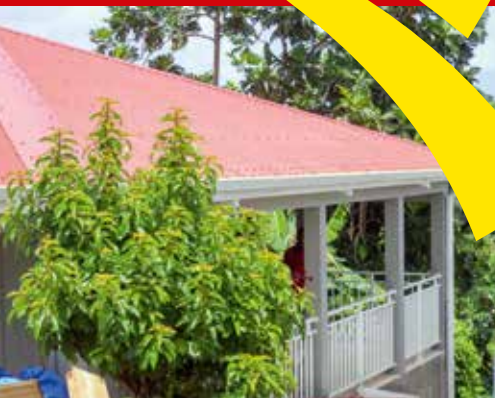
L'aide à l'amélioration de l'habitat

Pourquoi la ville du Robert s'est mobilisée ?