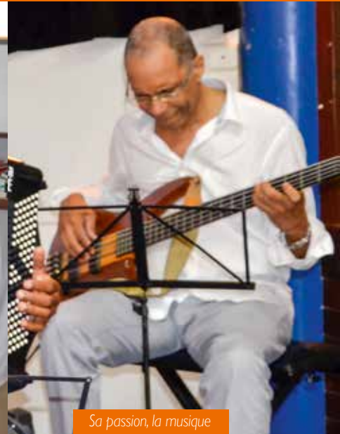
Sa passion, la musique