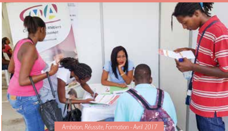
Ambition, Réussite, Formation - Avril 2017

Du 2 au 6 octobre 2017, 25 jeunes formés dans le secteur de l'hôtellerie et de la restauration sont partis à Albertville et ont participé à une première sélection de « Master Chef » sur le village Club du Soleil ainsi qu'à un forum des emplois saisonniers. A l'issue de ce voyage, les jeunes retenus par des chefs d'entreprise repartiront début décembre dans la région Savoie pour effectuer leur saison.