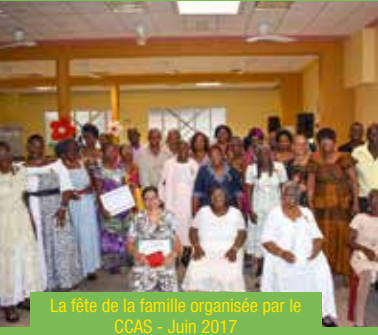
La fête de la famille organisée par le CCAS - Juin 2017