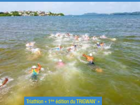
Triathlon « 1 ère édition du TRIGWAN »