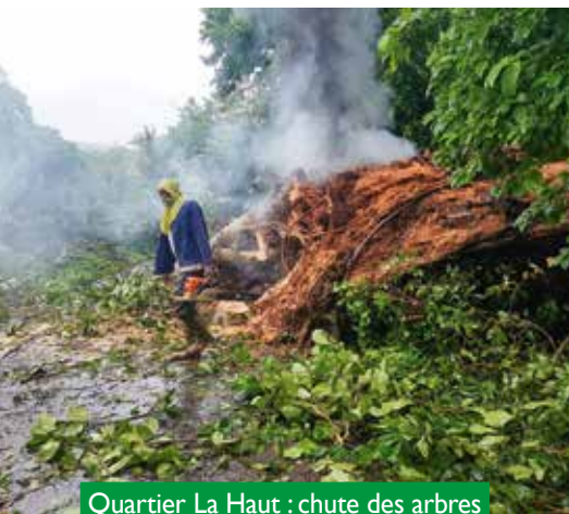
Quartier La Haut : chute des arbres