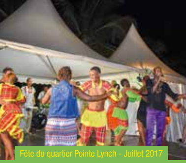
Fête du quartier Pointe Lynch - Juillet 2017