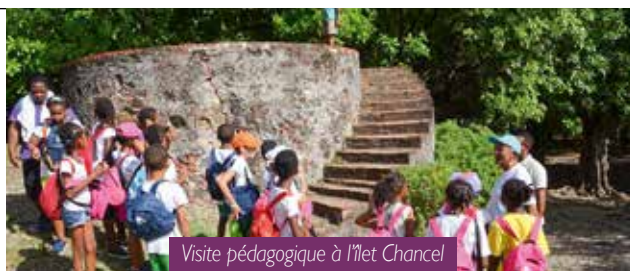
Visite pédagogique à l'Îlet Chancel

L'ensemble des actions menées se déroulaient lors des Nouvelles Activités Périscolaires, le jeudi de 13 heures à 16h.