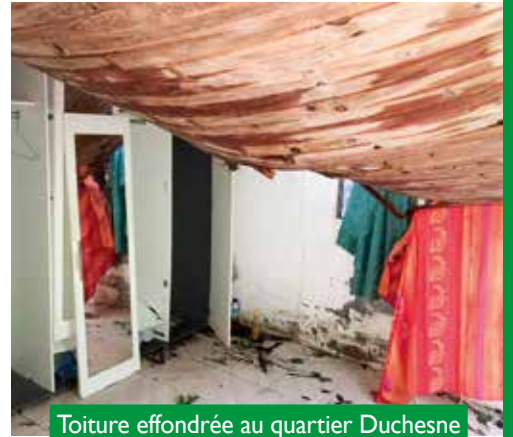
Toiture effondrée au quartier Duchesne