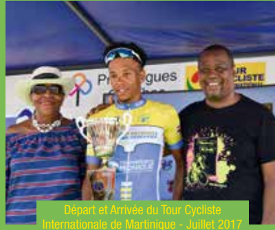
Départ et Arrivée du Tour Cycliste Internationale de Martinique - Juillet 2017