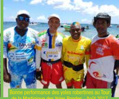
Bonne performance des voiles robertines au Tour de la Martinique des Voiles Rondes - Août 2017