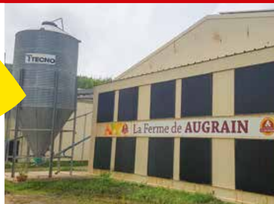
Les Robertins qui entreprennent